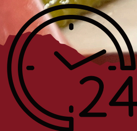
Planche de Charcuterie